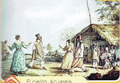
El cielito. Acuarela de C. Pellegrini.

Con motivo de la yerra (marcación del ganado) o de la cosecha, los dueños de los campos realizaban convites: invitaban con comida y bebida a los vecinos que los habían ayudado en las tareas. En las fiestas rurales también se bailaban danzas folclóricas.